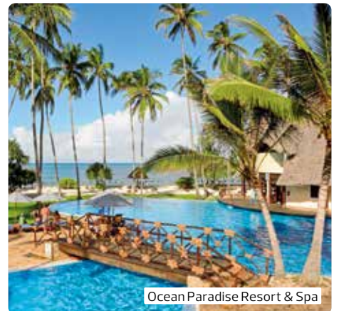
Ocean Paradise Resort & Spa

Frühstück an den Hippo-Pools besuchen Sie das Serengeti-Dokumentationszentrum, wo Sie noch einmal auf Prof. Dr. Grzimek treffen. Nach dem Mittagessen im Camp begeben Sie sich auf eine weitere Pirsch im Herzen der Serengeti. (F, M, A)