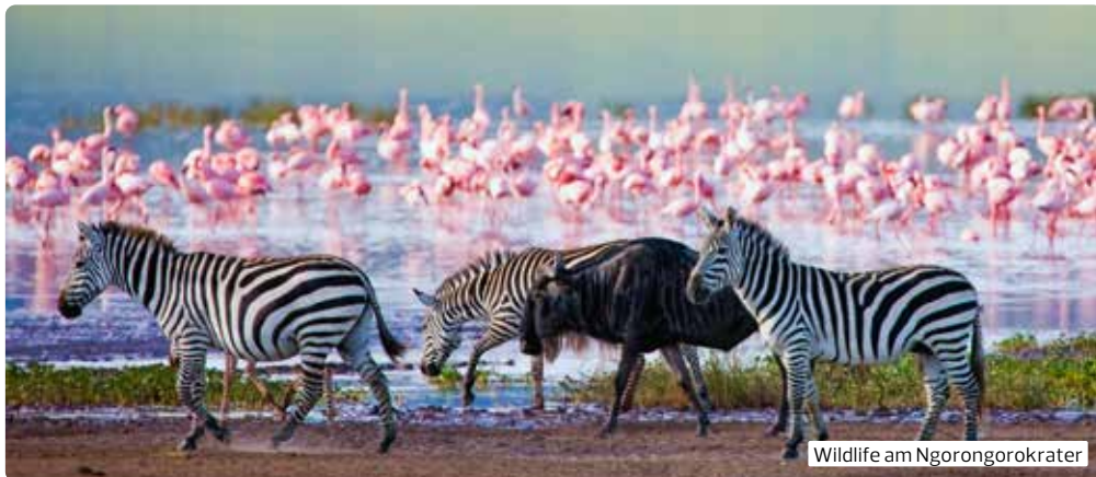
Wildlife am Ngorongorokrater