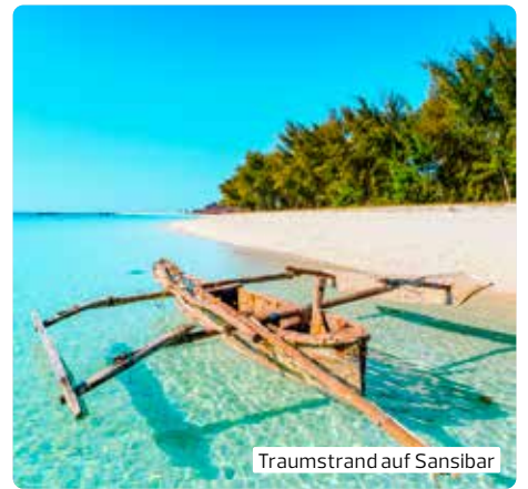
Traumstrand auf Sansibar